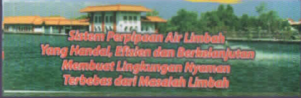
Sistem Perpipaan Air Limbah Yang Handal, Efisien dan Berkesinambungan Membuat Lingkungan Nyaman Terbebas dari Masalah Limbah